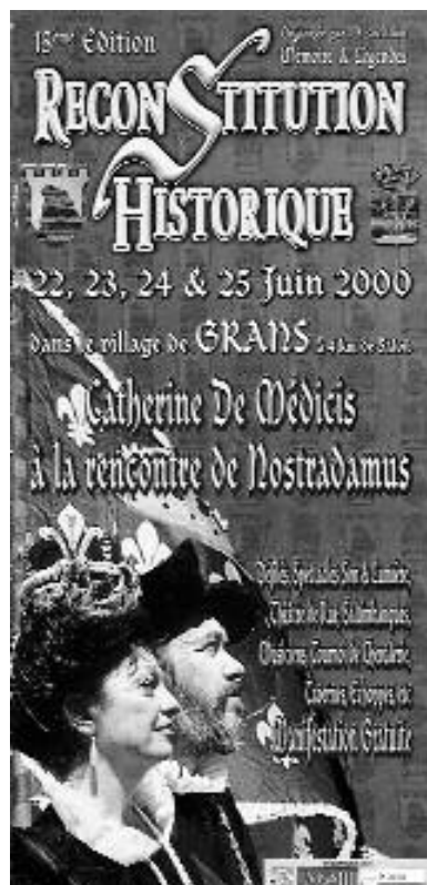
24. Nice-Matin, jeudi 3 août 2000.

Mais indiquons encore que l'Histoire joue parfois le rôle de révélateur social ou politique pour le présent, par un système de "re-jeux" et d'allusions à l'actualité. En 1990, le scénario de la ville de Salon intitulé Prélude aux Lumières signalait : "Mais ce n'est pas parce qu'elle découvrait en son sein ses ennemis les plus acharnés que la chrétienté oubliait de persécuter les juifs. Le temps n'était pas loin où un pape les obligea à porter, cousue sur leurs vêtements, la rouelle, un gros disque jaune qui les désignait. Nostradamus aurait pu la porter. Qui sait ?